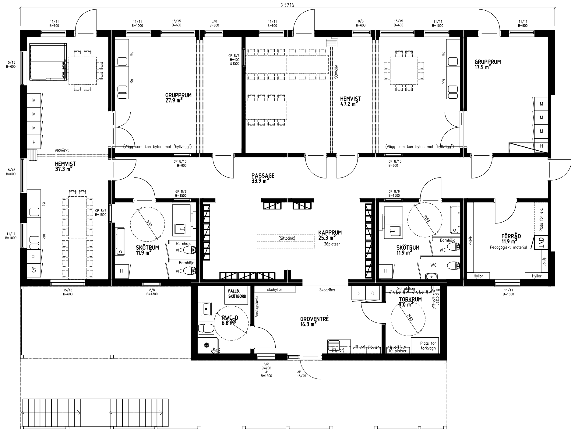
Avdelning plan 1 BTA 292.1m 2