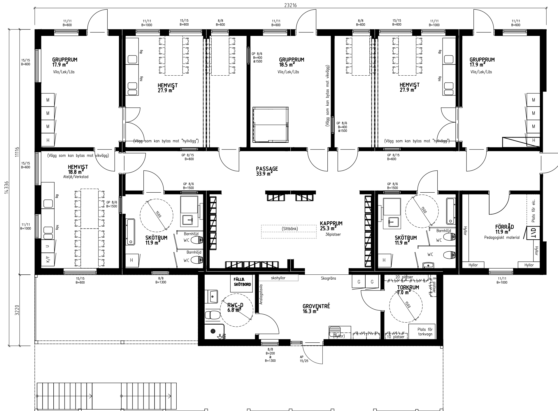
Avdelning plan 1 BTA 292.1m 2